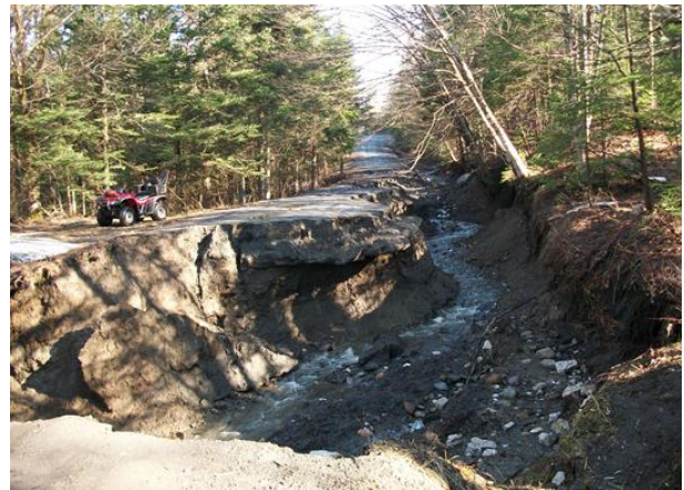
Portion dévastée du chemin Charest

Le 27 avril dernier, la municipalité devait mettre en opération le plan de sécurité civile lors des pluies diluviennes qui se sont abattues sur notre municipalité dans la soirée du 26 avril. Avec tout le tapis de neige qui était encore présent dans les forêts et l'accumulation d'eau les ponceaux et les ponts ont été dévastés à plusieurs endroits. Plusieurs points stratégiques ont été fermés à la circulation et certaines personnes ont été isolées pendant quelques jours. Les dommages les plus importants ont été causés au pont de ciment du chemin Charest et au pont de bois du chemin Duchesneau. Une équipe s'est mise au travail dès les premières heures pour permettre aux résidents