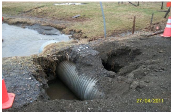
Ponceau du chemin Mailloux

La première représente une portion dévastée sur le chemin Charest. Ce chemin a été particulièrement affecté par la crue des eaux. Sur la deuxième photo, nous voyons que le ponceau était complètement à découvert et que les citoyens ont été isolés quelques heures seulement. Sur la troisième photo nous remarquons que la plage municipale a été aussi affectée par le déluge du 27 avril dernier.