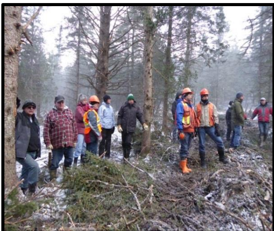
Participants lors d'une visite de chantier, chemin Owen, novembre 2014

Le réseau de sentiers de vélo de montagne est l'un des produits emblématiques du mont Hereford. Réputés à travers la province pour leur qualité et les panoramas qu'ils offrent, ils sont gérés par l'organisme à but non lucratif Circuits Frontières qui verse, tout comme le Club de chasse et pêche Hereford et les activités forestières, des redevances annuelles à Forêt Hereford, participant ainsi au développement de la Forêt communautaire. Les revenus de Circuits Frontières ont augmenté de plus de 43 % depuis les deux dernières années, dont 13 % durant l'année 2014. Ces chiffres, présentés lors de son assemblée générale annuelle le 16 février dernier, ont de quoi ravir! De plus, 45 % des utilisateurs de la dernière année provenait de la région des Cantons-de-l'Est, suivi de la région de Québec (12 %), la région de la Montérégie (11 %) et de Montréal (10 %). Le vélo de montagne, tout comme la randonnée, permettent donc aux résidents d'avoir accès à ce territoire, et contribuent à augmenter l'achalandage touristique de la région.