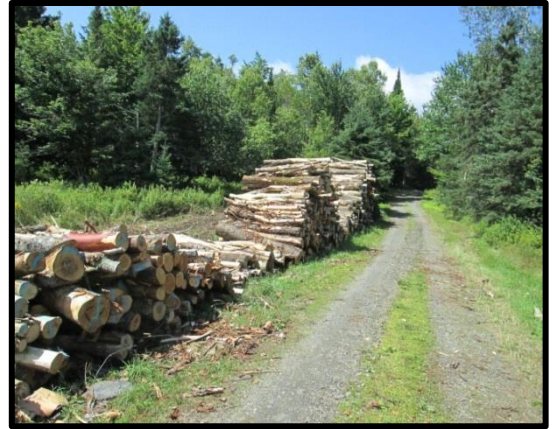
Empilement de bois sur le chemin Owen, août 2014