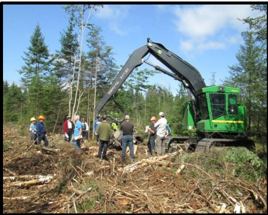
Visite de chantier d'aménagement forestier, chemin Owen, août 2014

Sur le plan de la foresterie, des travaux ont lieu cet été et cet automne dans le secteur du chemin Owen, excepté durant les périodes de chasse. Au total, un peu plus de 11 000 m 3 (environ 300 voyages de bois) ont été récoltés, ce qui a permis d'atteindre le niveau de récolte annuel qui est déterminé pour l'ensemble du territoire de la Forêt communautaire (11 584 m 3 ). Ces travaux ont été réalisés par Aménagement forestier et agricole des Sommets qui a embauché des entrepreneurs de la région. La majorité des bois récoltés a été mise en marché localement, notamment à Coaticook, East Hereford, St-Malo, East Angus et Windsor. Il est estimé que ces travaux d'aménagement forestier ont permis le maintien d'une quinzaine (15) d'emploi à temps complet en forêt et en usine. Ce n'est pas rien! Deux visites terrains ont été organisées pour les intervenants impliqués. De plus, la Forêt communautaire dispose maintenant d'une planification forestière quinquennale dynamique, lui permettant maintenant de toujours savoir où seront situés les travaux forestiers des cinq années à venir.