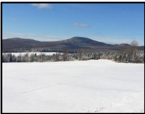
Mont Hereford et ses monts voisins, chemin des Côtes, janvier 2015

Rappelons que ce territoire est une grande forêt privée, mais dont la gestion et les retombées doivent profiter aux communautés locales. L'accessibilité est l'une des valeurs importantes de la mission de cette Forêt communautaire, mais les activités doivent s'y développer dans un contexte d'encadrement et de planification à long terme convenu par tous. L'information et la sensibilisation sont la clé pour maintenir la fierté et l'adhésion à ce projet unique au Québec. Le développement du site Web ( www.forethereford.org ) et la mise en ligne éventuelle d'une page Facebook contribueront à augmenter le transfert d'information.