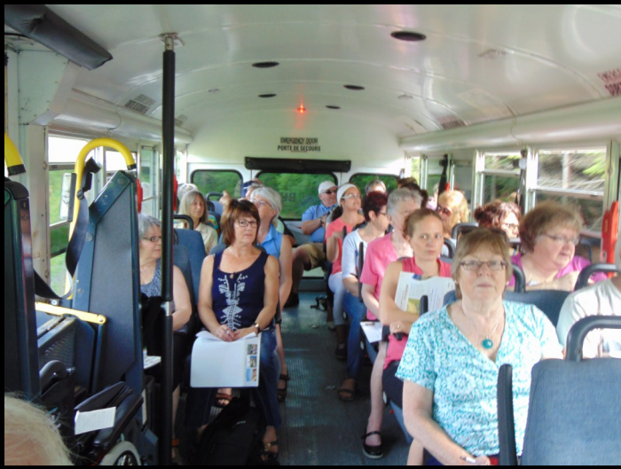
Tout le monde en autobus, c'est un départ