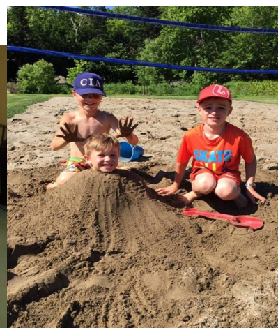
À la plage dans le sable, on s'amuse