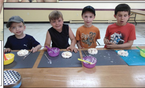
Le 28 juin dernier avait lieu une activité avec la collaboration des producteurs de lait du Canada. Le Grand Chef Galette a montré aux jeunes à faire une crousti pizza qu'ils ont naturellement mangée avec appétit.